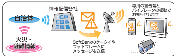
緊急速報メールイメージ