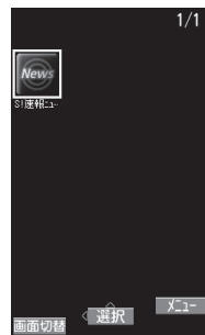
ウィジェットアイコン一覧画面