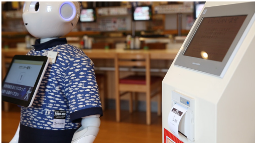
満席の場合は Pepper で受付をして、発券された用紙を持って待合所でお待ちいただくよう案内

ステムベンダーと共に開発を進め、空席管理システム・発券機と連携することで、Pepper がタイムリーに空席状況を把握し、番号札を発券・座席へ案内できるようになっています。