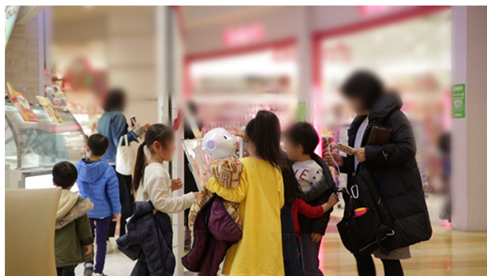
Pepper に集まる子どもたち