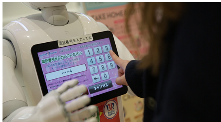
入力された電話番号宛てに LINE お友達登録用 URL を送信

るんだなというのは私も初めて知りましたし、その抵抗感を下げる存在として Pepper は非常に有効なんだと勉強しました。