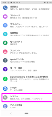
「システム」をタップしてください。