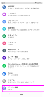
「デバイス情報」をタップしてください。