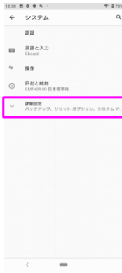
「詳細設定」をタップしてください。