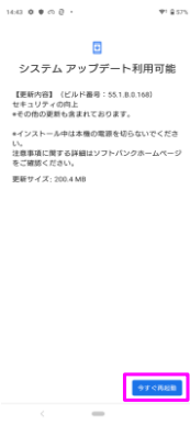
システム アップデートが利用可能になりました。「今すぐ再起動」をタップしてください。