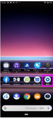
「設定」をタップしてください。