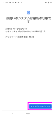
「アップデートをチェック」をタップしてください。