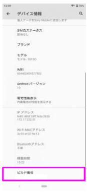
ビルド番号が最新であることを確認してください。