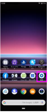
「設定」をタップしてください。