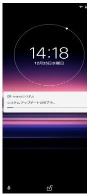
システム更新を完了しています。