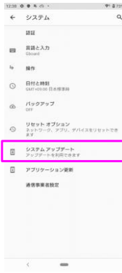
「システムアップデート」をタップしてください。