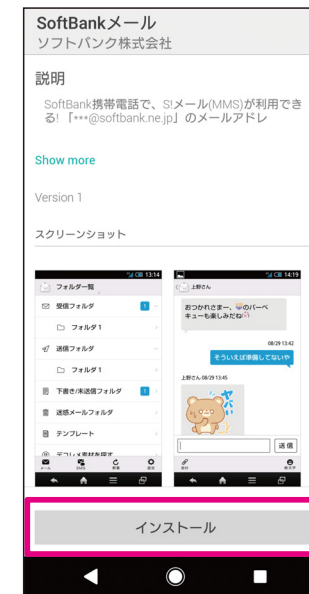
【インストール】もしくは 【再インストール】を選択