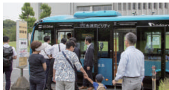
2018年6月232名 オープンセミナー