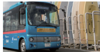
2018年9月500名 スポーツイベント