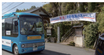
2019年4月403名 鳥取県八頭町