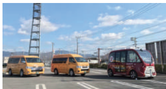
2019年3月80名 セレモニーイベント