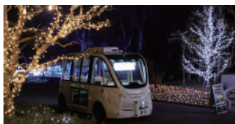
2018年12月550名 浜松市フラワーパーク