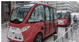
2017年12月252名 東京都 丸の内