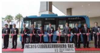
2017年11月140名 沖縄県宜野湾市