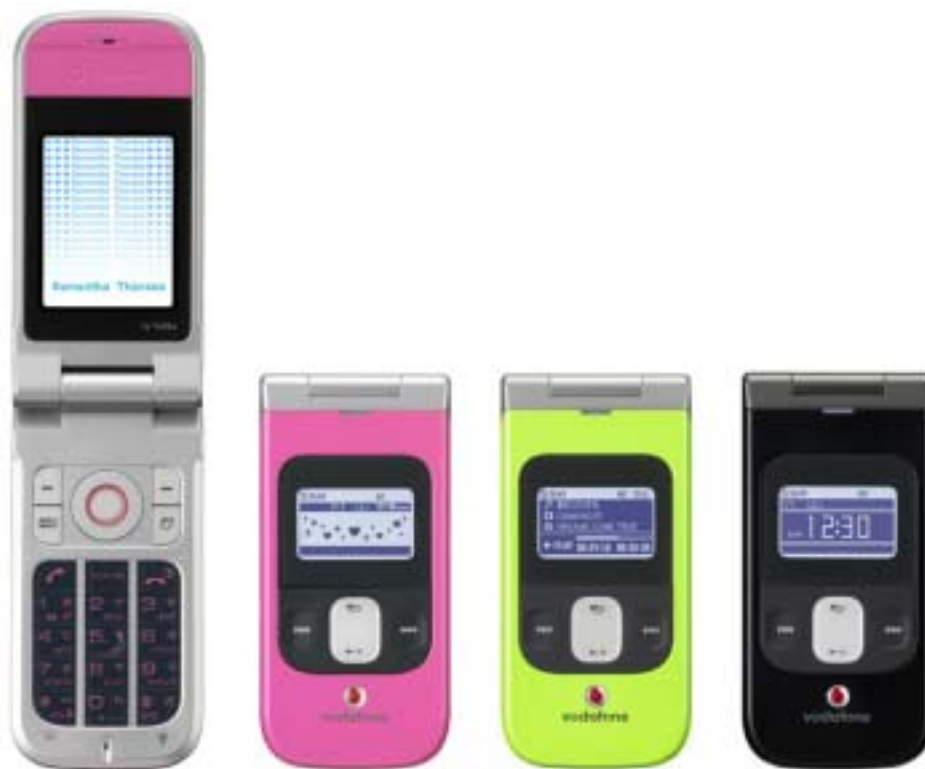
左から、スプラッシュピンク/ラッスルグリーン/アーバンブラック