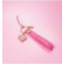
オリジナルストラップ