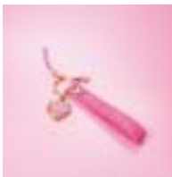
プレミアム携帯 ストラップ