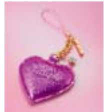
オリジナルハートミラー ストラップ