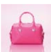
ミニポストバッグ