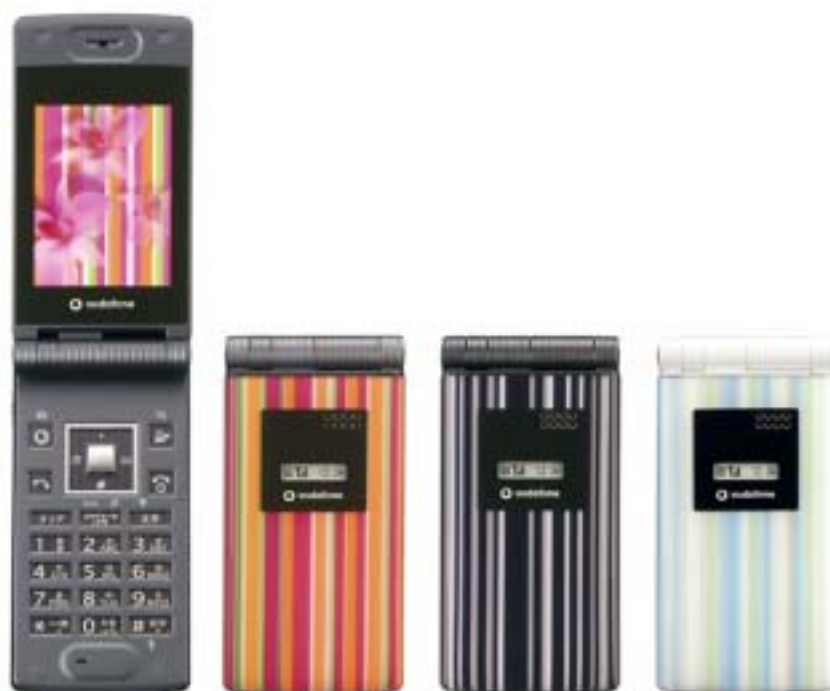
左から、レッドストライプ/ブラックストライプ/ブルーストライプ