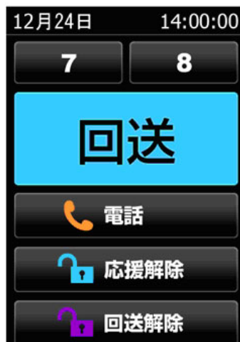
乗車メニュー(応援/回送)画面