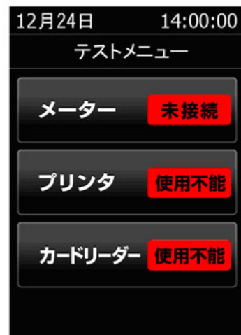
外部機器接続確認画面