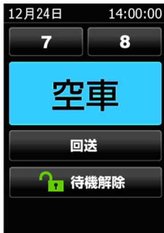
乗車メニュー画面(空車)