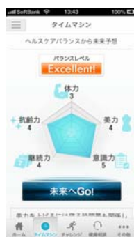
ヘルスケアバランス

5つの指標で、体の状態を分析。活動量に基づいてレーダーチャートで、分かりやすく解説します。