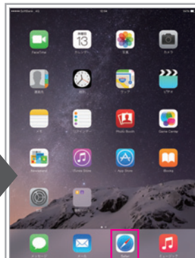
ホーム画面より「Safari」をタップ