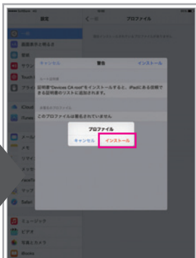
ポップアップが出るので「インストール」をタップ