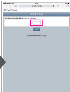
ご契約時に登録された数字4桁の暗証番号を入力

「同意して設定開始」をタップしたとくと、 ・「My SoftBank」 ・「メニューリスト」 ・「Yahoo! JAPAN」 などのショートカットがホーム画面に表示されます。簡単にアクセスすることができ大変便利です。