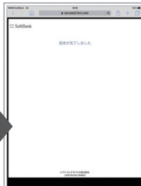
インストール完了