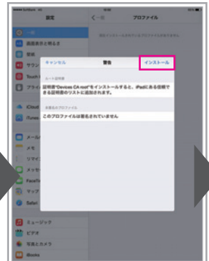
もう一度「インストール」をタップ