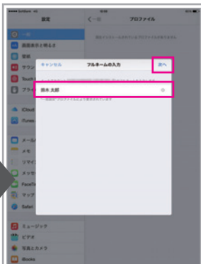
フルネームを入力し、「次へ」をタップ(入力内容はメール送信先に通知されます)