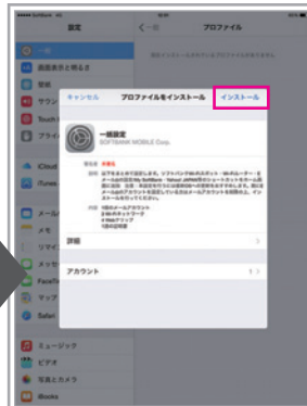
「インストール」をタップ