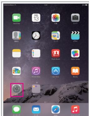
ホーム画面より「設定」をタップ