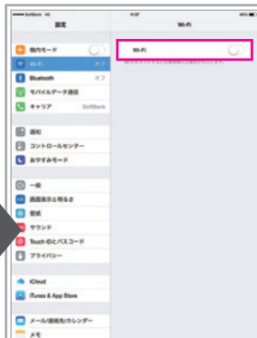
「Wi-Fi」を「オフ」に(3G/4G通信で設定してください)