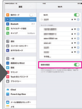
「接続を確認」を「オン」に (2回目以降は自動で Wi-Fiに接続します)