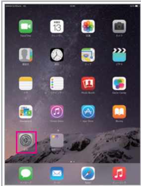
ホーム画面より 「設定」をタップ