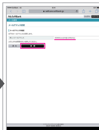
入力したメールアドレスを確認し、「変更」をタップ