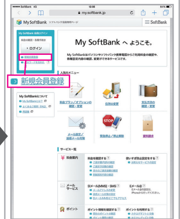
「新規会員登録」をタップ