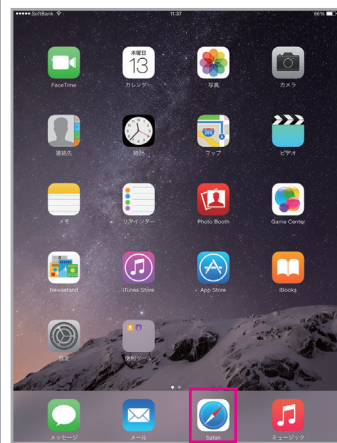
ホーム画面より「Safari」をタップ

【ソフトバンクお客さまセンター】 ソフトバンクケータイから 157 一般電話から 0800-919-0157