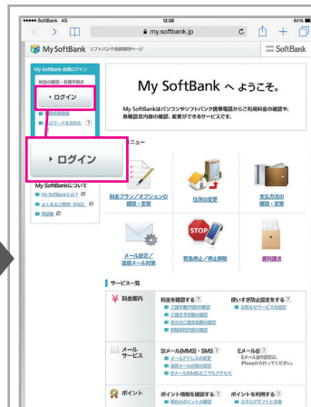
トップに戻りログイン ※初回ログイン時のみ「利用規約」が表示されますので、「同意」してください