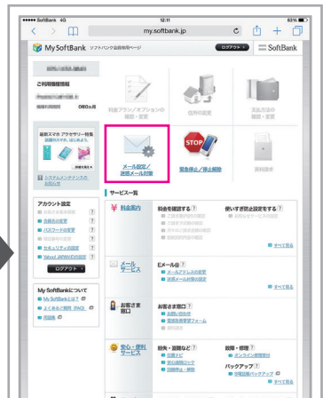
「メール設定/迷惑メール対策」をタップ