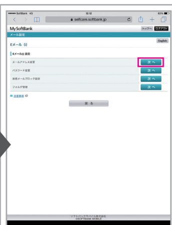
「メールアドレス変更」項目の「次へ」をタップ