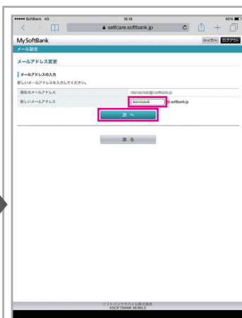
ご希望のメールアドレスを入力し「次へ」をタップ