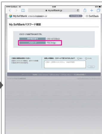
My SoftBankのパスワードが表示されます(パスワードはメモに控えてください)