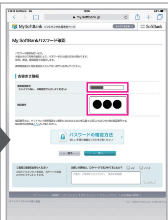
携帯電話番号(データ通信契約番号)とご契約時に登録された数字4桁の暗証番号を入力