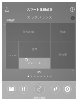
測定結果をもとにした「カラダバランス」グラフ