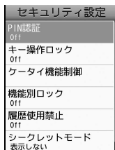
セキュリティ設定画面