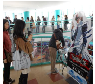
- 謎解きスタンプラリーの行列 -

詳細はイベント情報サイト参照 http://cosmoworld.jp/yugioh/